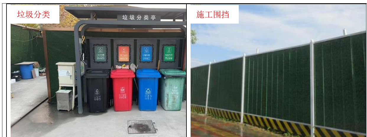
图6-1 施工期环保措施