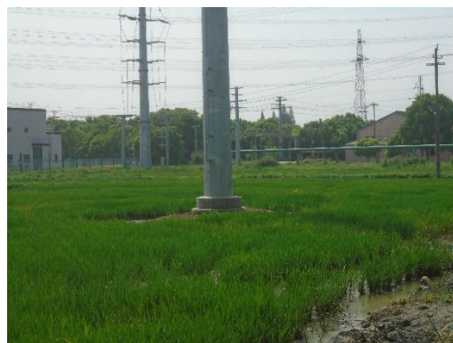
110kV1423/1424 获庄线#3 塔基周围 生态恢复照片