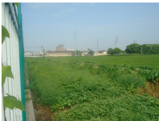
获塘 110kV 变电站北侧生态恢复照片