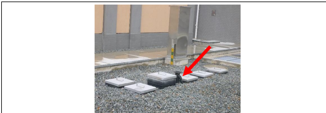
图 8-3 220kV 坞家变地理式污水处理装置照片

本项目 220kV 坞家变无人值班，变电站建有化粪池，日常运检人员产生的生活污水经地理式污水处理装置处理后，不外排。