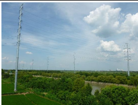
110kV 均恒 7863/均润 7862 线#36-#37 杆塔一档跨越丹金溧漕河（金坛区）洪水调蓄区照片