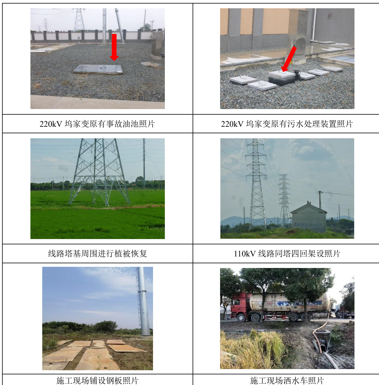
图 6-1 本项目相关环保措施照片