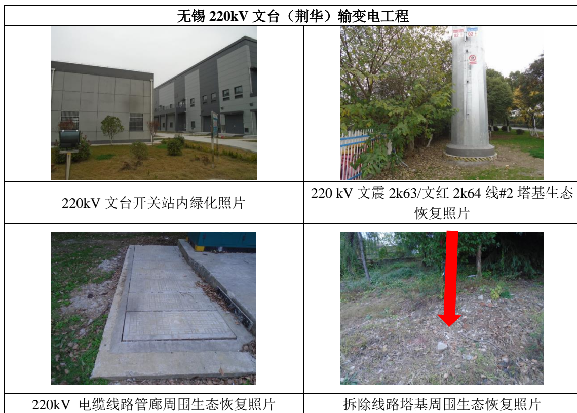
图 8-1 项目周围生态环境恢复情况

通过现场调查确认，本工程施工建设及环境保护设施调试期很好地落实了生态恢复和水土保持措施，未发现施工弃土弃渣随意弃置、施工场地和临时占地破坏生态环境及造成水土流失问题的现象。开关站及线路塔基周围的土地已恢复原貌，线路塔基建设时堆积的渣土均已平整并进行绿化，未对周围的生态环境造成破坏。本工程周围生态环境恢复情况及相关环保设施情况见图 8-1。