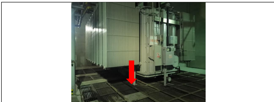
110kV 唐义变电站#1 主变事故油坑

按照《火力发电厂与变电站设计防火标准》（GB 50229-2019）规范要求，现有事故油坑容量有效容积能够满足变压器贮存最大油量的 100% 要求。