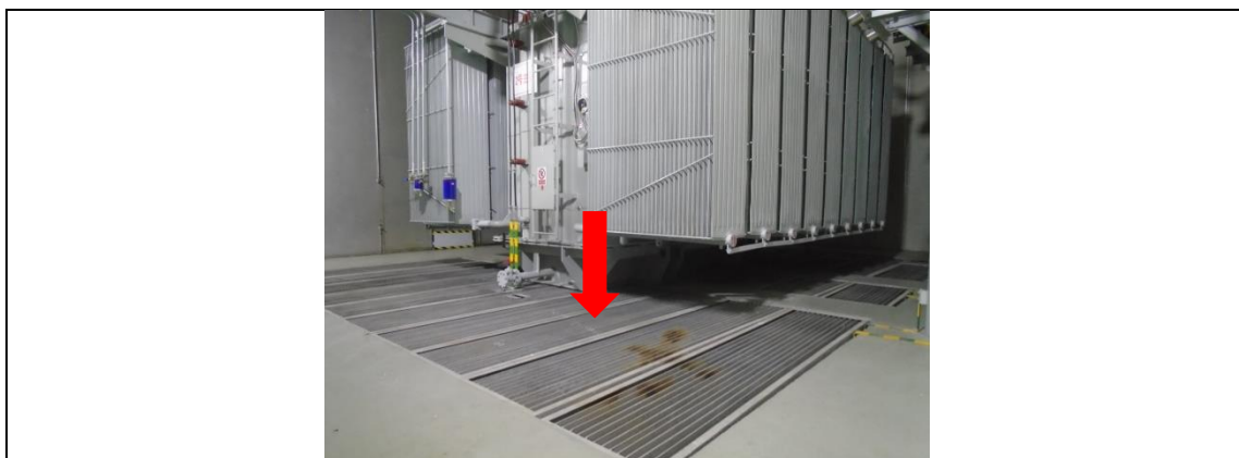
110kV 双庙变电站#2 主变事故油坑

按照《火力发电厂与变电站设计防火标准》（GB 50229-2019）规范要求，现有事故油坑容量有效容积能够满足变压器贮存最大油量的 100% 要求。