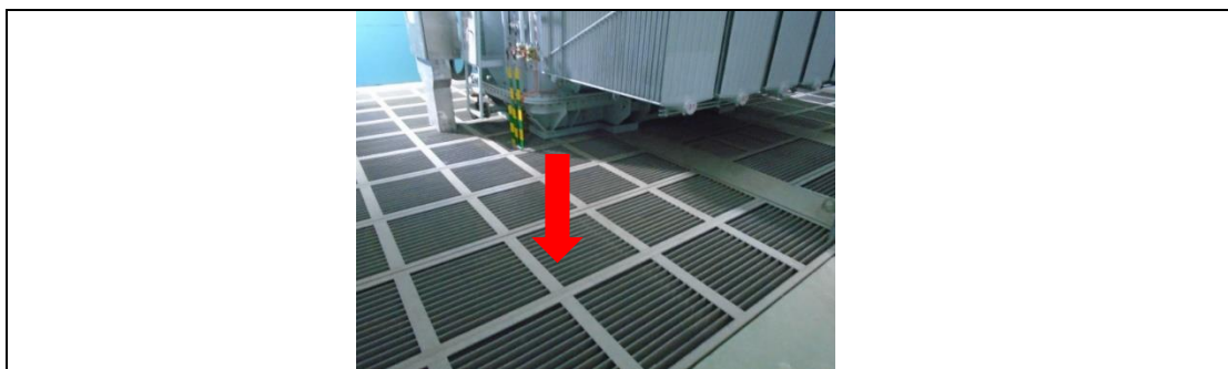
110kV 梅村变电站#3 主变事故油坑

按照《火力发电厂与变电站设计防火标准》(GB 50229-2019) 规范要求，新建事故油坑容量有效容积能够满足变压器贮存最大油量的 100% 要求。