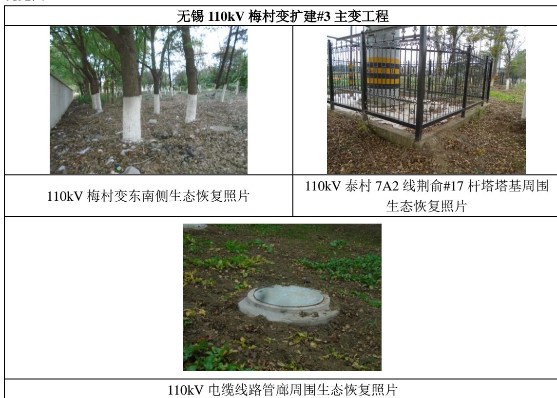
图 8-1 项目周围生态环境恢复情况

通过现场调查确认，本工程施工建设及环境保护设施调试期很好地落实了生态恢复和水土保持措施，未发现施工弃土弃渣随意弃置、施工场地和临时占地破坏生态环境及造成水土流失问题的现象。变电站及线路塔基周围的土地已恢复原貌，电缆线路建设时堆积的渣土均已平整并进行绿化，未对周围的生态环境造成破坏。本工程周围生态环境恢复情况及相关环保设施情况见图 8-1。