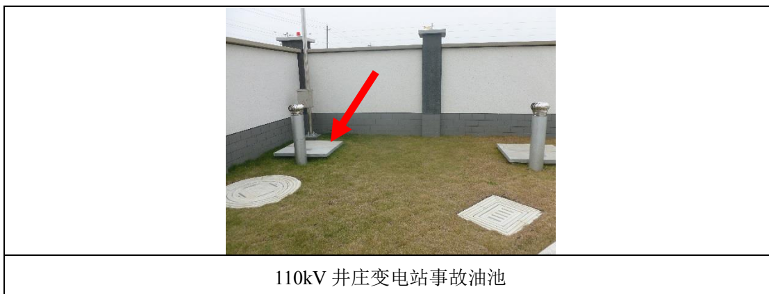
图 8-2 本次验收的变电站事故油坑示例

按照《火力发电厂与变电站设计防火标准》（GB 50229-2019）规范要求，新建主事故油池容量有效容积能够满足变压器贮存最大油量的 100%要求。