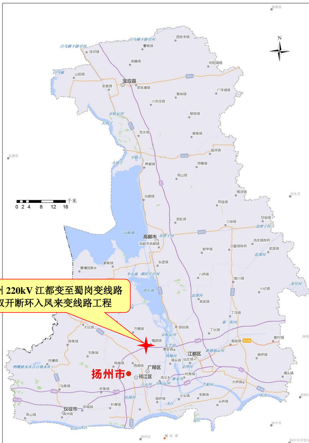
附图 1 扬州 220kV 江都变至蜀岗变线路双开断环入凤来变线路工程地理位置示意图