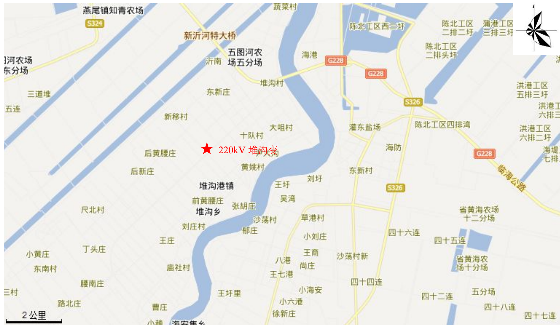
附图1 220kV 堆港变地理位置图