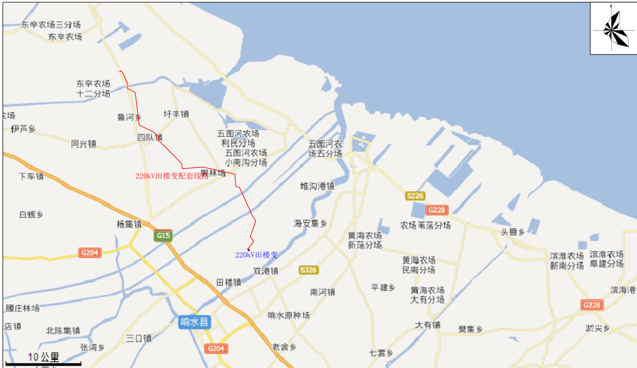
附图1 220kV田楼（浦三）输变电工程地理位置图