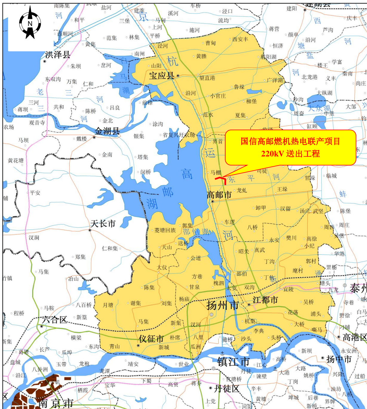
附图 1 国信高邮燃机热电联产项目 220kV 送出工程地理位置示意图